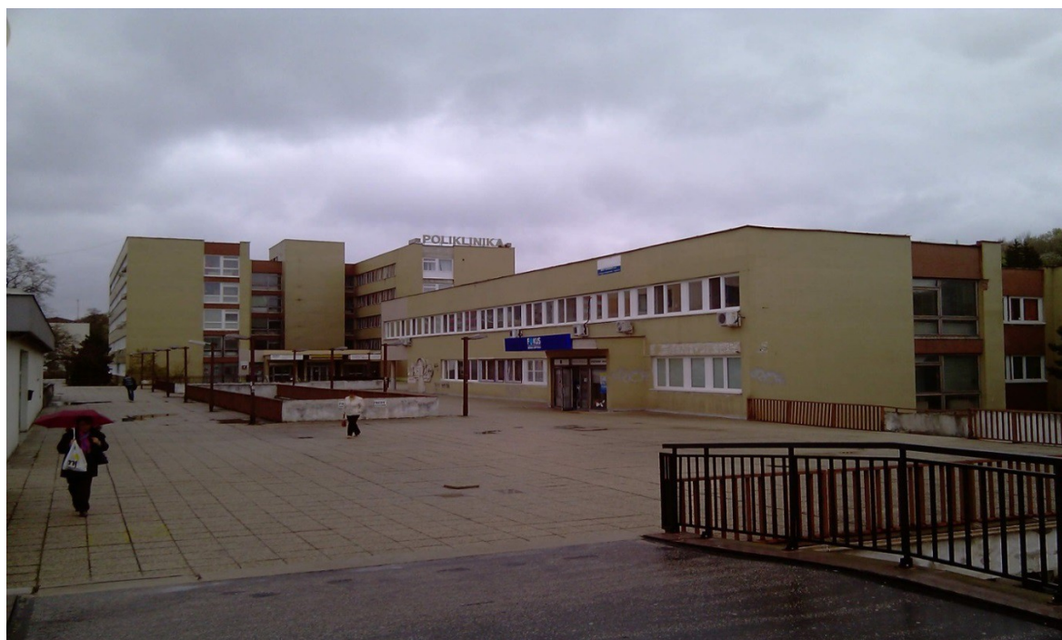
budova sanatória – Donnerova 1 (súpisné číslo 716)